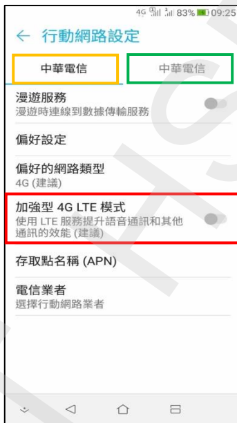
5. 選擇 SIM1/SIM2