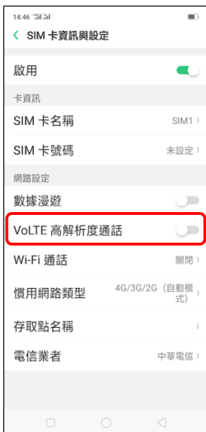
4.VoLTE 高解析度通話 (關 → 開 )