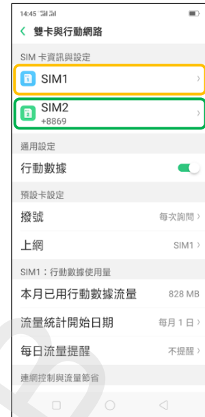
3.選擇 SIM1 / SIM2