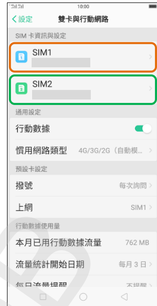
3.選擇 SIM1/SIM2 (例如：SIM1)