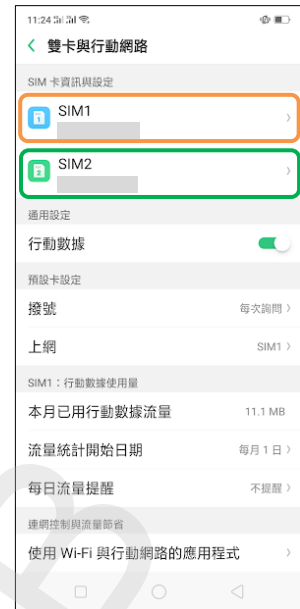
3.選擇 SIM1 / SIM2