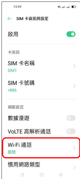
4. Wi-Fi 通話