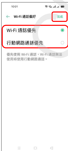
7.自行選擇→完成 (例：Wi-Fi 通話優先)