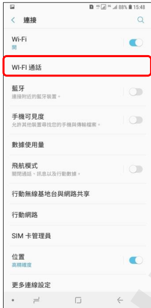
4. Wi-Fi 通話