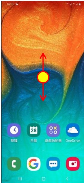
1. 向上或向下滑動以開啟應用程式螢幕