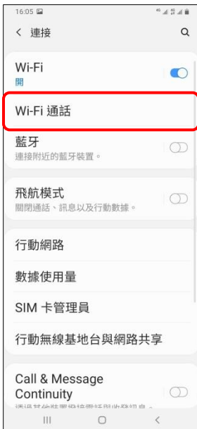
4. Wi-Fi 通話