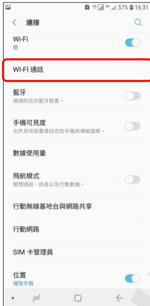
4. Wi-Fi 通話