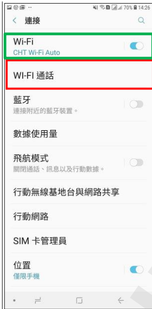
4. Wi-Fi 通話