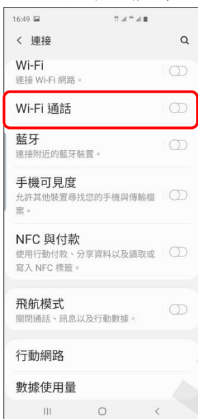
4. Wi-Fi 通話