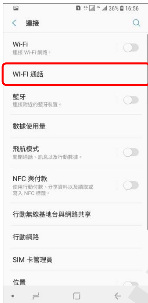
4. Wi-Fi 通話