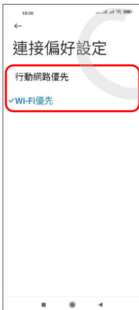
7. 自行選擇 (例：Wi-Fi 優先)