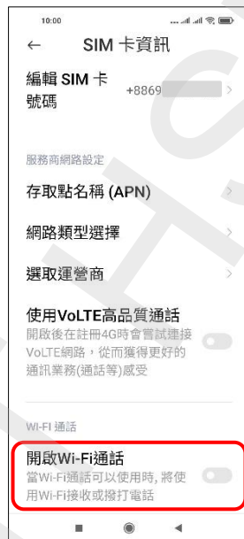
5. 開啟 Wi-Fi 通話 → 開啟