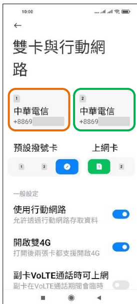
4. 選擇 SIM1/SIM2