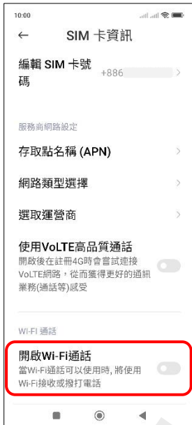
4.開啟 Wi-Fi 通話 →開啟